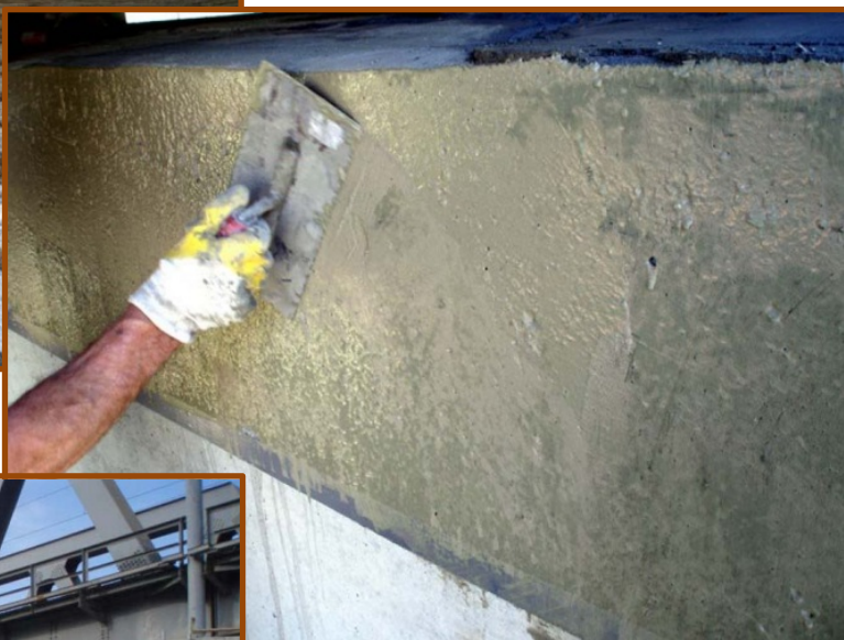
Reabilitarea pilor CF peste Prahova