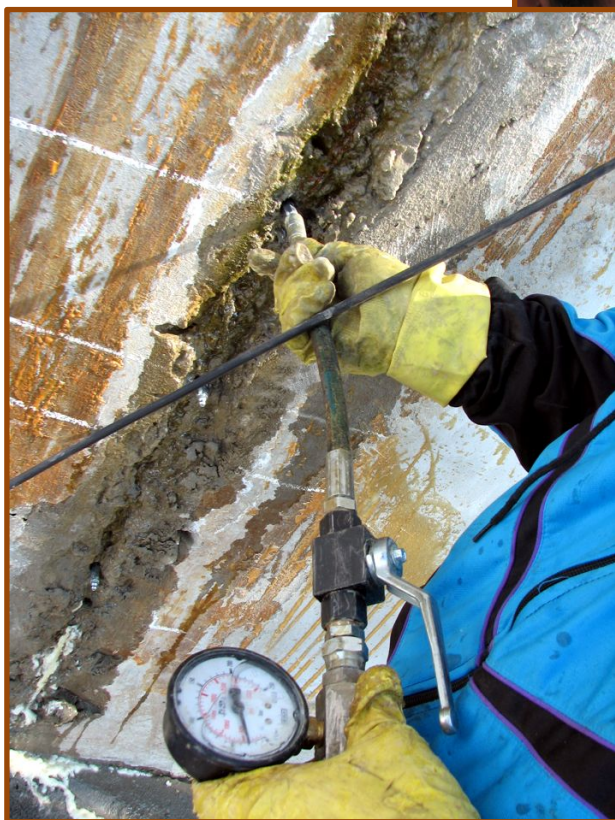
Injecții în spatele structurilor de beton îngropate