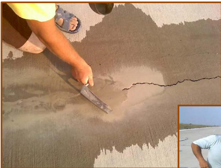
Colmatare fisuri cu silicați solubili