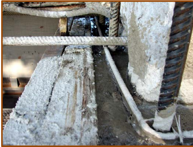
Refacere structurala cu betoane auto-compactante